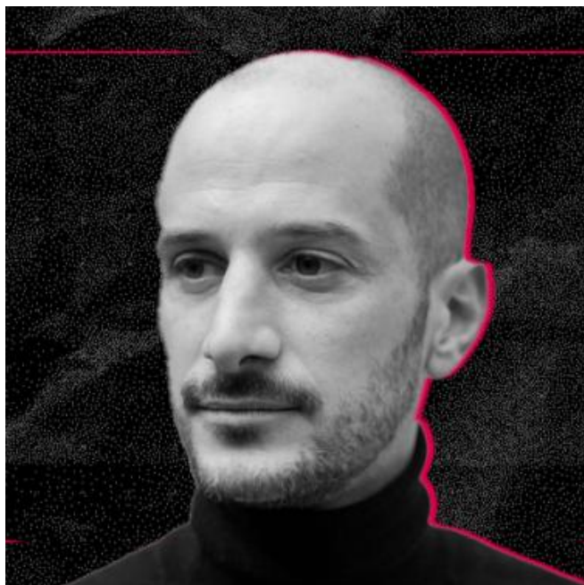
Mise à jour du 15 octobre 2025 : selon de nouvelles

https://www.arte.tv/fr/videos/113043-088-A/le-regard-des-journalistes-ukrainiens/