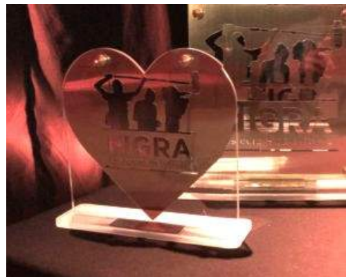
Coup de cœur du Conseil des enfants de Douai

Image : Sandra Calligaro Montage : Mikael Buzo Production : France Télévisions