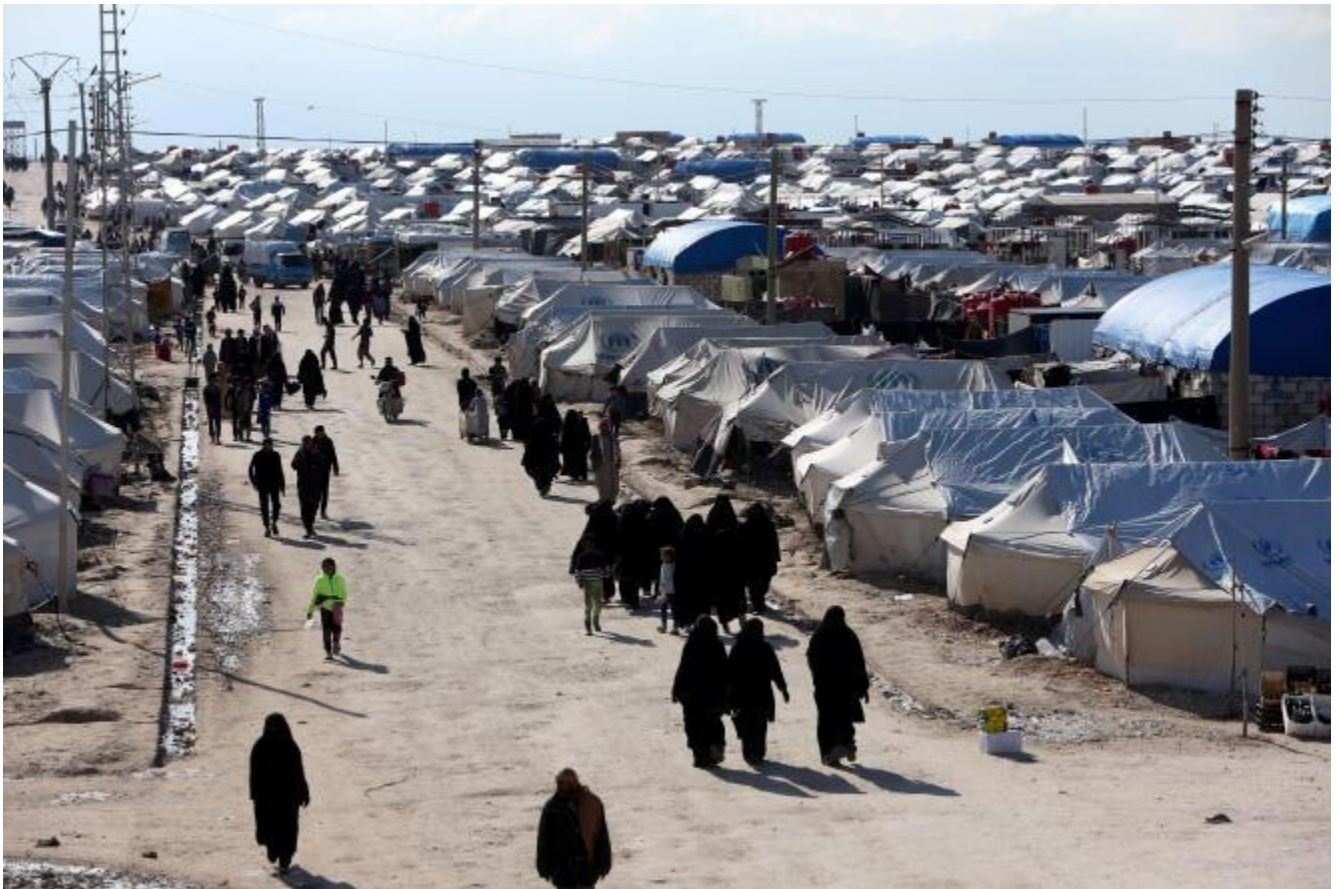
Dans le camp d'Al-Hol, en Syrie, en avril 2019.

Préparer un dossier sur le camp de déplacés d'Al-Hol et problématiser une réflexion, un questionnement pour des échanges ou un débat.