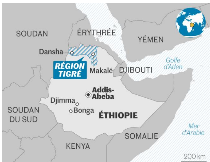
Carte de l'Éthiopie et de la région du Tigré. INFOGRAPHIE LE MONDE

Trouver un sujet et un angle sur cette région