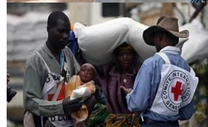
CHILD STARVING, UGANDA, 1980 -