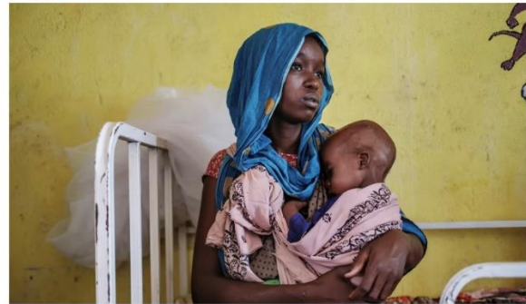
Une femme tient un enfant souffrant de malnutrition dans le centre de santé de Kelafo (Éthiopie).

Pendant deux ans, la région du Tigré a littéralement vécu sous blocus, privée de tout, de nourriture, de soins, d'électricité, de téléphone, de carburant. Depuis septembre, même l'aide humanitaire n'avait plus le droit d'entrer au Tigré.